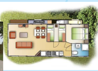
Typ 3 ORLANDO