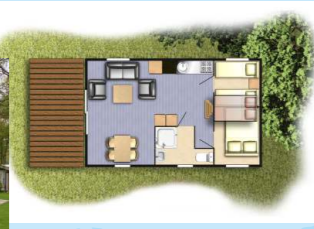
Typ 4 KAJÜT-LODGE