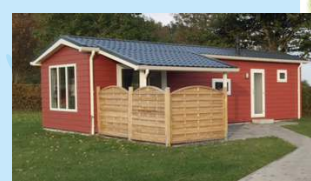
Typ 1 OCALA

12 hochwertige Ferienhäuser für 2 bis 6 Personen im Grünen • ruhige Lage am Waldrand am Campingplatz • direkt an der Pferde-Weide • ca. 500 m zur Ostsee • ab 80 m zum Spielplatz • Wohn-/Esszimmer mit offener Küche mit Spülmaschine, 2 Schlafzimmer (1 x Ehebett, 1 x Kinderzimmer mit 2 Betten) - bei Typ 2/Lodge plus Schlafboden, bei Typ 3/Orlando 3 Betten im Kinderschlafzimmer - • SAT-TV / W-LAN* • überdachte Terrasse mit Terrassenmöbeln und Grill • Fahrradständer